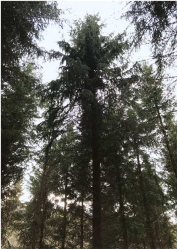
Abbildung 4: Z-Baum Nr. 68 im Bestand