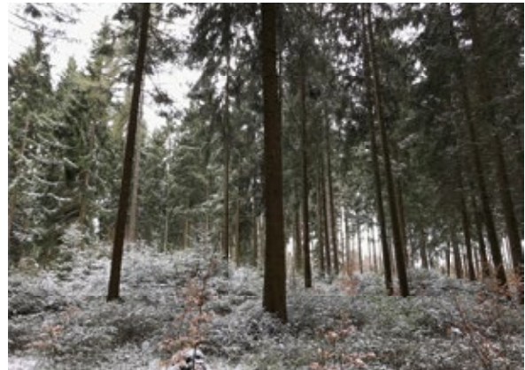
Abbildung 1: In der Jugend vom Schnee gebrochener Bestand mit langen grünen Kronen

tungen, dass sich im Halbschatten offener Wegränder oder entlang von Straßen und Autobahnen gerade die Fichte regelmäßig üppig verjüngt sowie die Tatsache, dass Traufbäume immer stärker im Durchmesser sind als gleichaltrige im Bestandesinneren sind ein Fingerzeig, wie die Fichte zu bewirtschaften ist, um stabile Bestände mit einem hinreichenden Anteil an Fichten-Naturverjüngung zu erziehen.