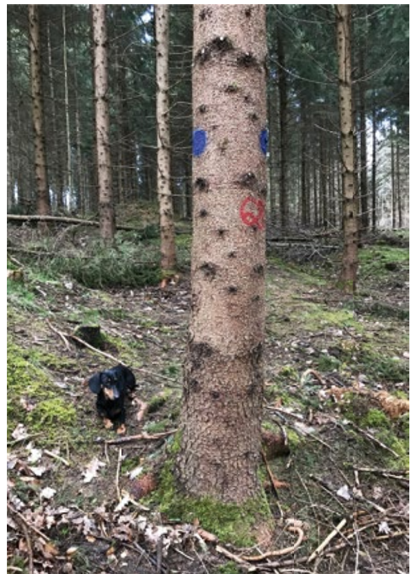
Abbildung 3: Z-Baum Nr. 68 mit 31 cm BHD