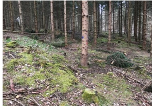
Abbildung 2: Freigestellter Z-Baum Nr. 68 nach Drittdurchforstung

entfernt werden; das Mittel lag bei ermittelten 2,7 Entnahmebäumen pro Z-Baum. Bemerkenswert dabei ist, dass es sich fast ausschließlich um relativ starke Bäume der Kraft'schen Klasse 2, nur selten 3, gehandelt hat. Es ist offensichtlich, dass nicht nur die Z-Bäume, sondern auch die randständigen, künftigen Entnahmebäume von einer halbseitigen Freistellung und dem daraus folgenden Lichtungszuwachs profitieren. Erneut wurde nach dem Eingriff das Ergebnis mit dem ganzen Forstteam besichtigt und diskutiert. Nun war