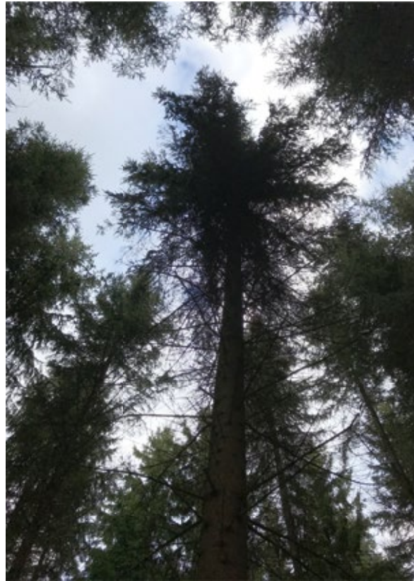
Abbildung 5: Kronenraum und Freistellungsgrad von Z-Baum Nr. 68

man sich einig, dass die Weichen für die Zukunft der vorhandenen Z-Bäume endgültig gestellt waren – ein Umsetzen kam aufgrund der Freistellung nicht mehr in Betracht. Die Z-Bäume hatten einen deutlichen Wuchsvorsprung und den gewünschten Habitus (lange grüne Kronen, relativ geringe h/d-Werte, Abbild eines vitalen und stabilen Bestandesgerüsts). Auch waren wir uns darin einig, dass bei einem nächsten Eingriff – der wieder nicht zu spät erfolgen sollte – auch in den Zwischenfeldern negative Bestandesglieder entnommen und zwecks einer Entspannung des dortigen Kronenraums normal, also stark niederdurchforstungsartig, eingegriffen werden sollte.